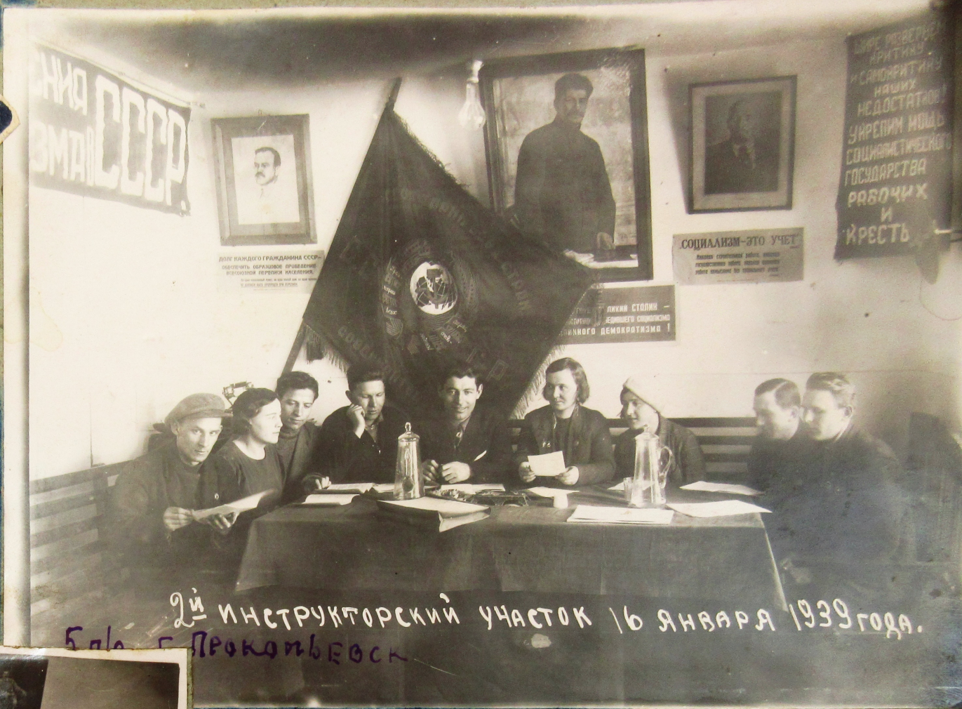
2й инструкторский участок 16 января 1939 года. Благодаря Прокотьевск