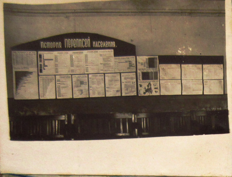
Выставка "История переписей населения" в клубе им. Ворошилова и гор. кино-театре.