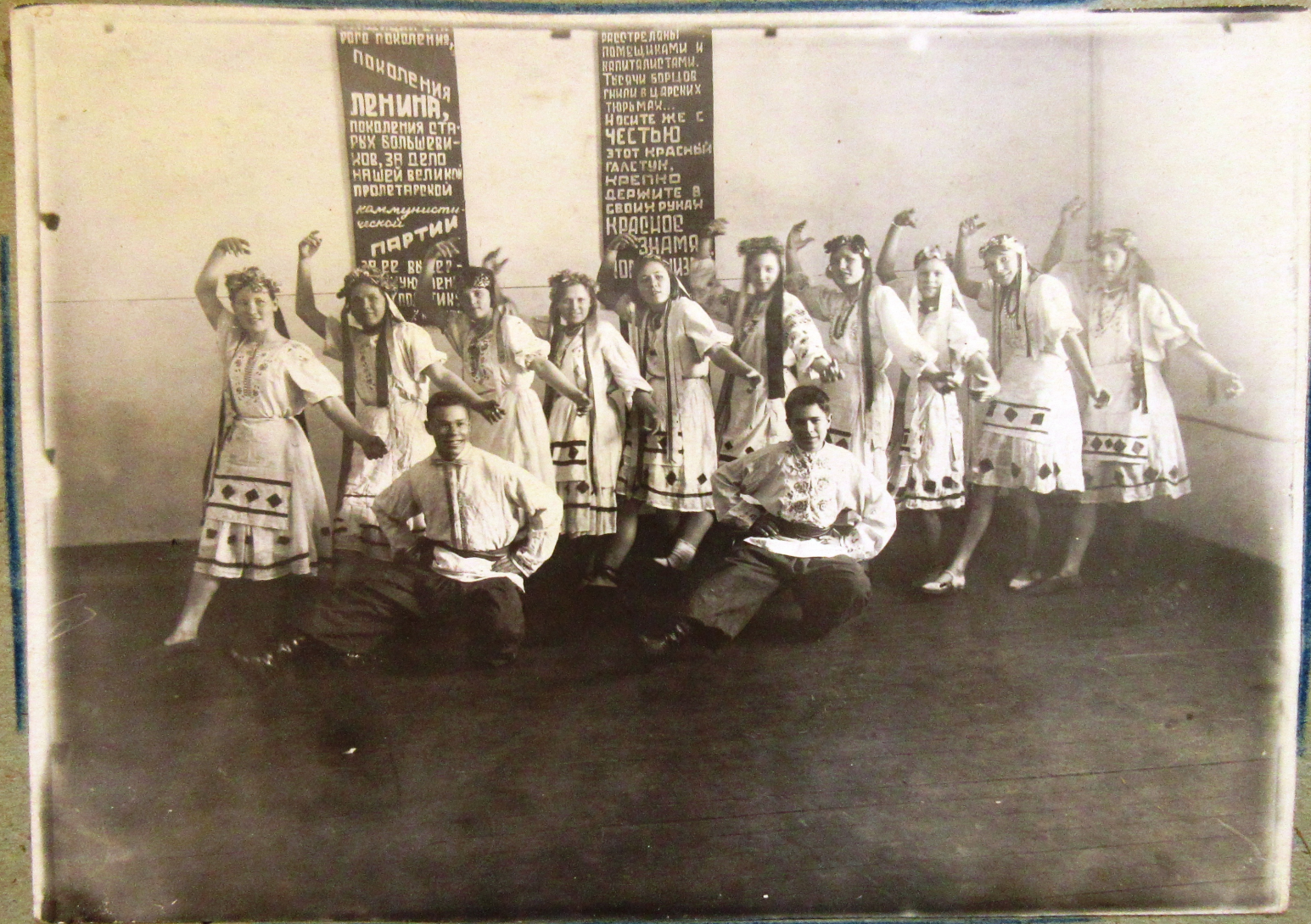
Будоражающее обязательное облуживание трудящихся после вечеров вопросов и ответов в 4-м про. (танец "Топак" исп. школьники средней школы 49).