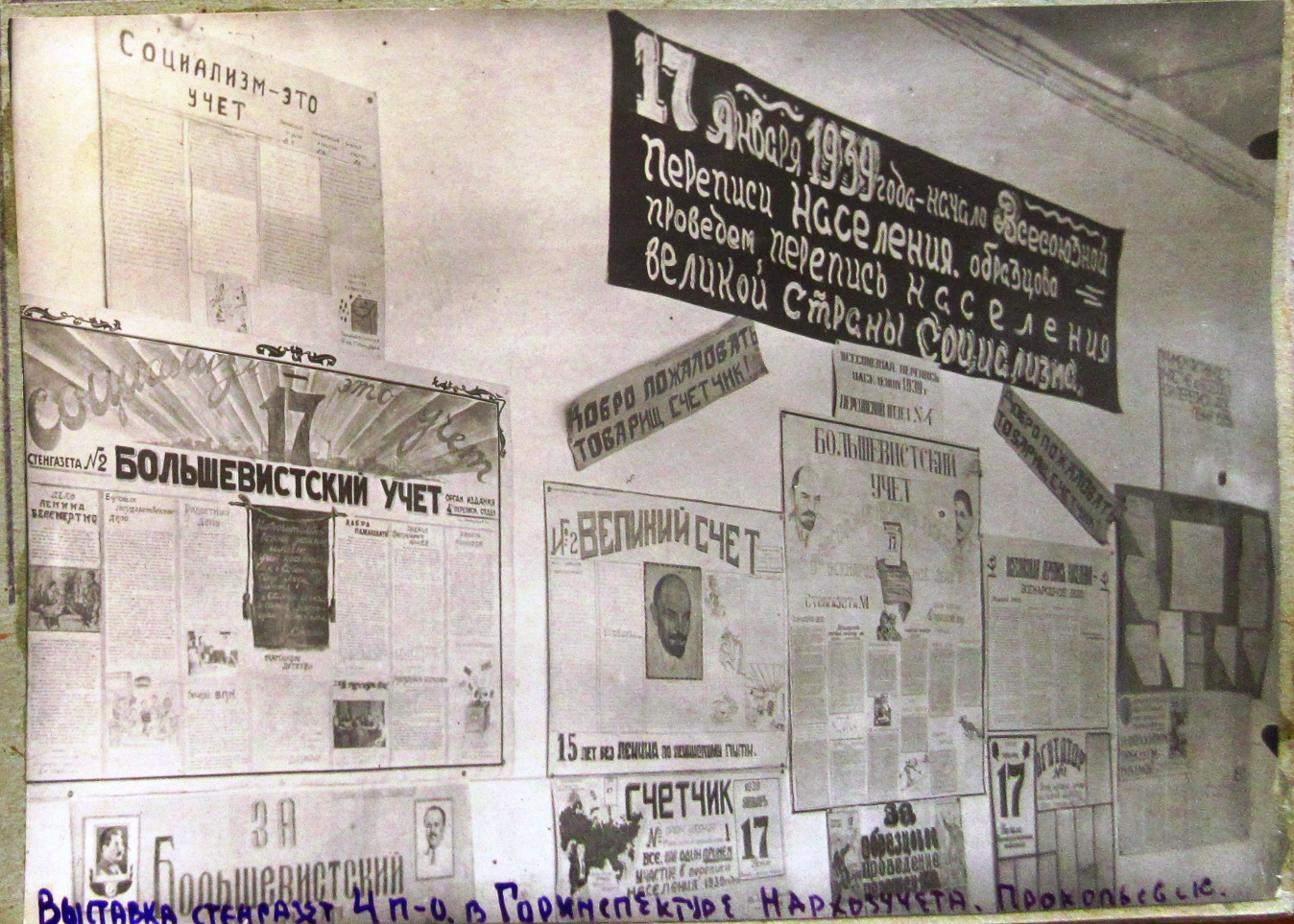
Выставка стенгазет 4 п-о. в Горинспектуре Нархозучета. Прохоровск.с.с.

Большую помощь в проведении ВПН оказала печать: В районной газете "Ударник Кузбасса" и микротиражке "Сталинец" помещено статей 164. Выпущено стенных газет по организациям 411.