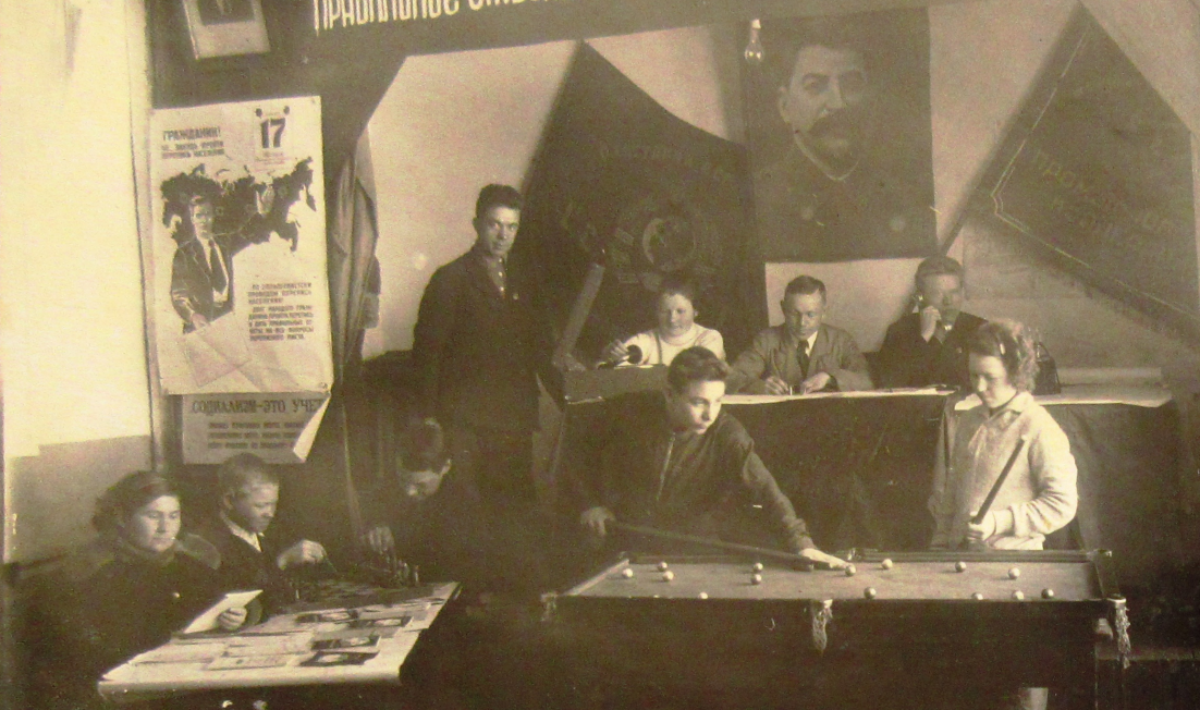
Инструкторский участок 16 января 19...