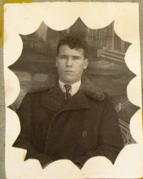
СЧЕТЧИК - ОТЛИЧНИК